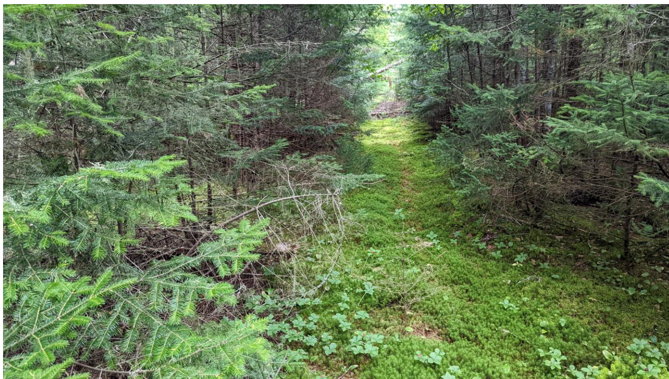
PHOTOGRAPHIE 1 : SENTIER PRÈS DE LA LIMITE SUD-EST DU LOT