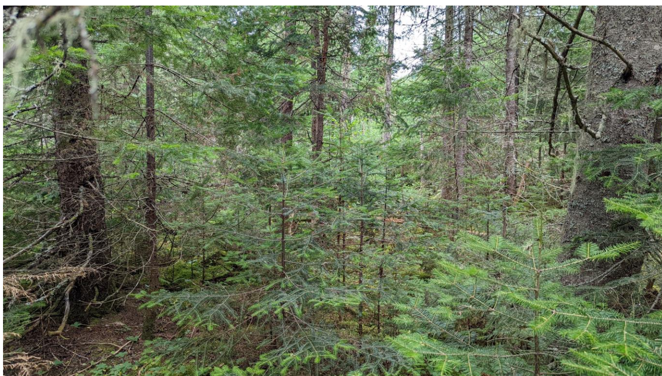
PHOTOGRAPHIE 2 : MILIEU FORESTIER SUR STATION TERRESTRE, DOMINÉ PAR LES CONIFÈRES