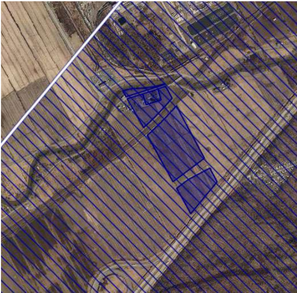
MRC Vaudreuil-Soulanges comprise dans le Groupe A

Lots : 2734478, 1687004, 1687005, 2678378, 2734479