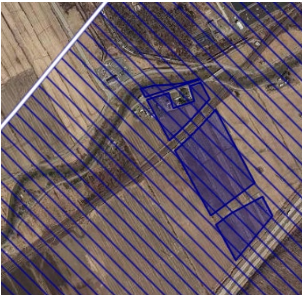
MRC Vaudreuil-Soulanges comprise dans le Groupe A

Lots : 1687004, 1687005, 2678378, 2734479