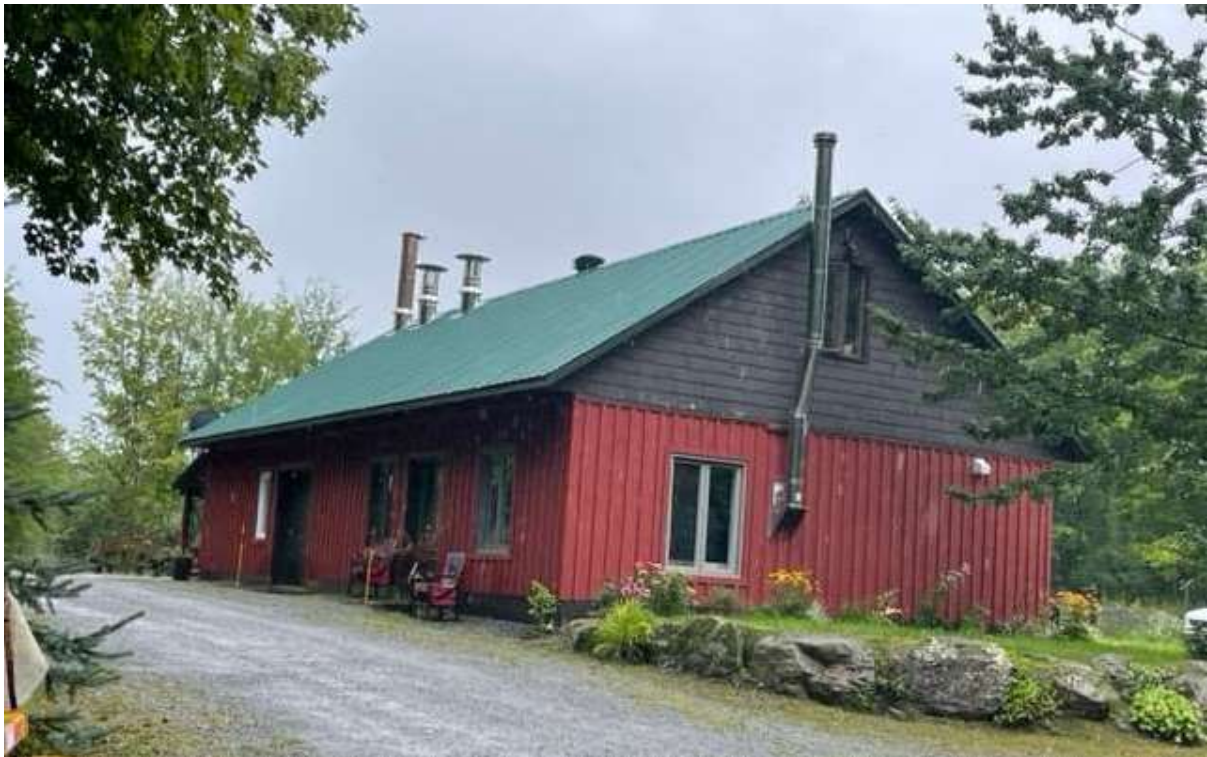
Photo – Cabane à sucre